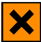
Xn Nocivo Nocive