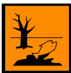
N Peligroso para el medio ambiente Dangerous for the environment