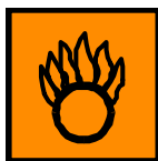
O Comburente Oxidizing

Símbolos: O: Comburente, Xn: Nocivo, N: Peligroso para el medio ambiente